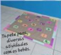
Tapete para diversas atividades com os bebês.