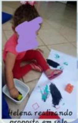
Helena realizando proposta em sala.