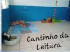
Cantinho da Leitura