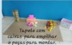
Tapete com caixas para empilhar e peças para montar.