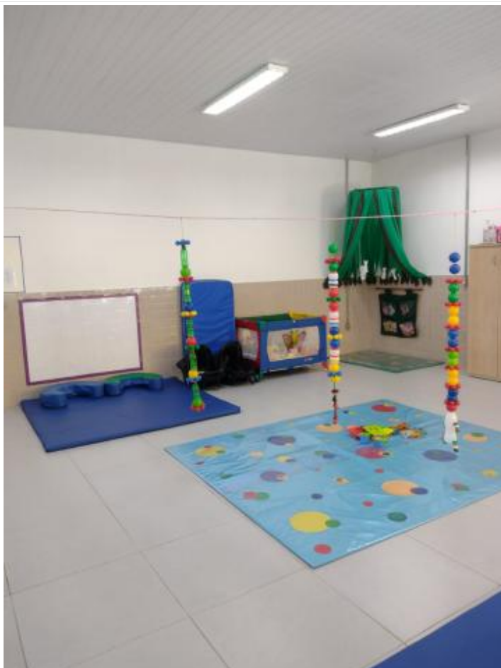
Espaços da sala de referência (1)