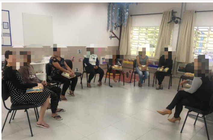
Reunião de Pais - Programa Recupera Alfabetização