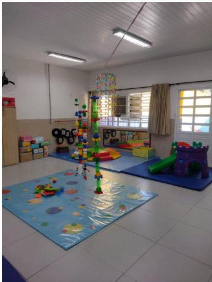
Espaços da sala de referência (3)