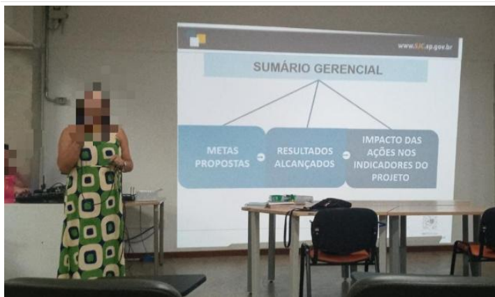
Formação CEFE 11-04-2022 (8)