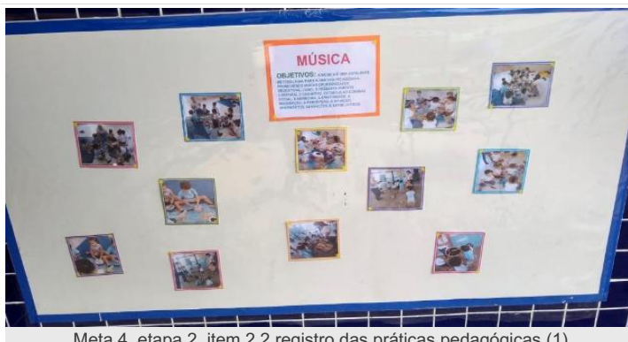
Meta 4, etapa 2, item 2.2 registro das práticas pedagógicas (1)