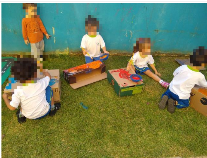
Realização de propostas (9)