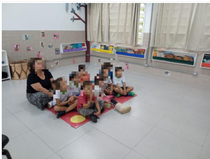
Realização de propostas (7)