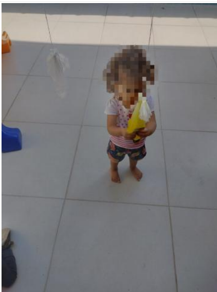
Realização de propostas (11)