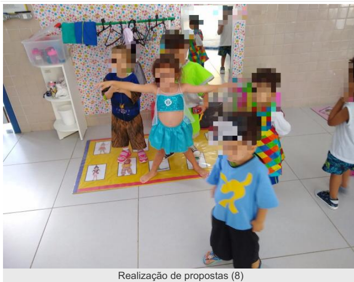
Realização de propostas (8)