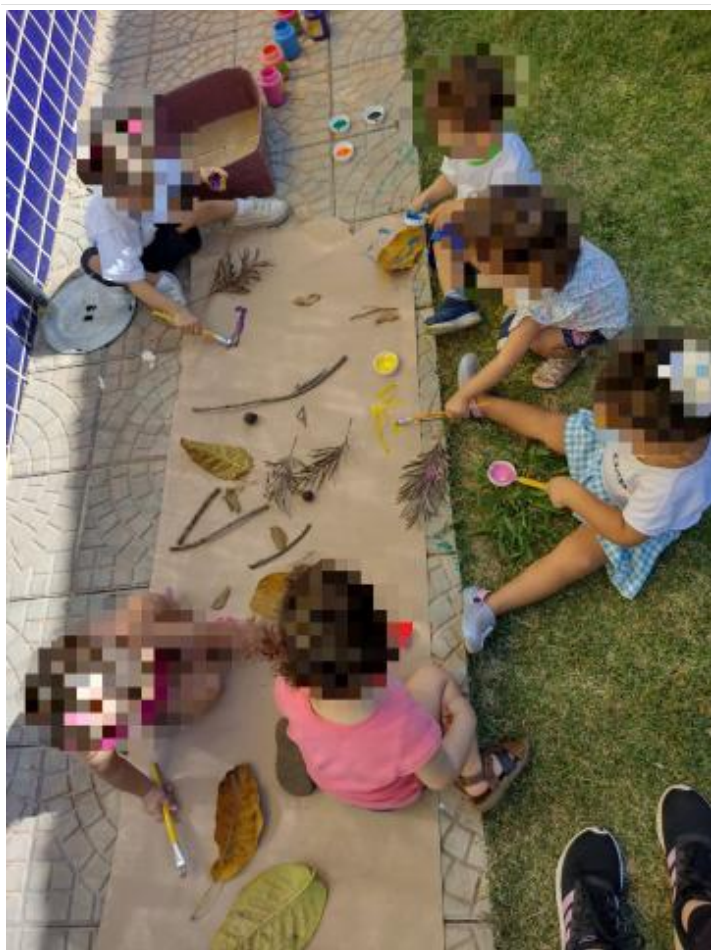
Realização de propostas (10)